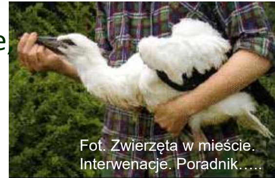
Fot. Zwierzęta w mieście. Interwencje. Poradnik.....