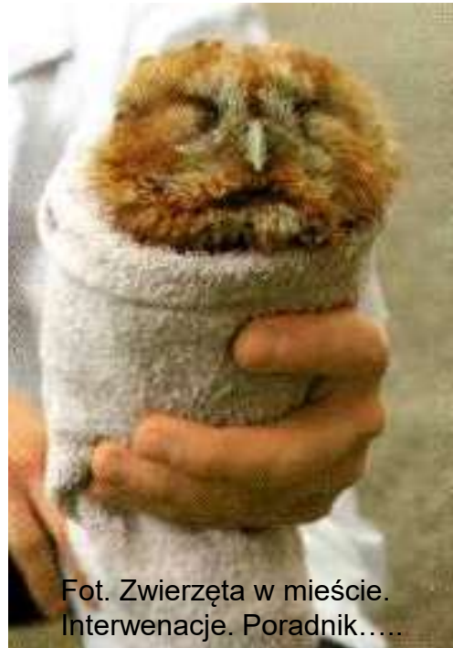
Fot. Zwierzęta w mieście. Interwencje. Poradnik.....