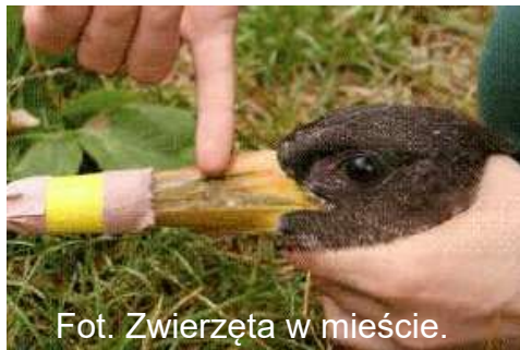
Fot. Zwierzęta w mieście. Interwencje. Poradnik.....