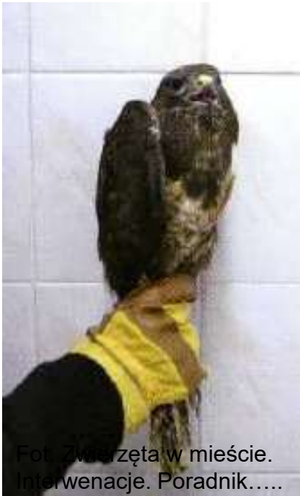
Fot. Zwierzęta w mieście. Interwencje. Poradnik.....